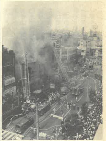
写真と記事は関係ありません