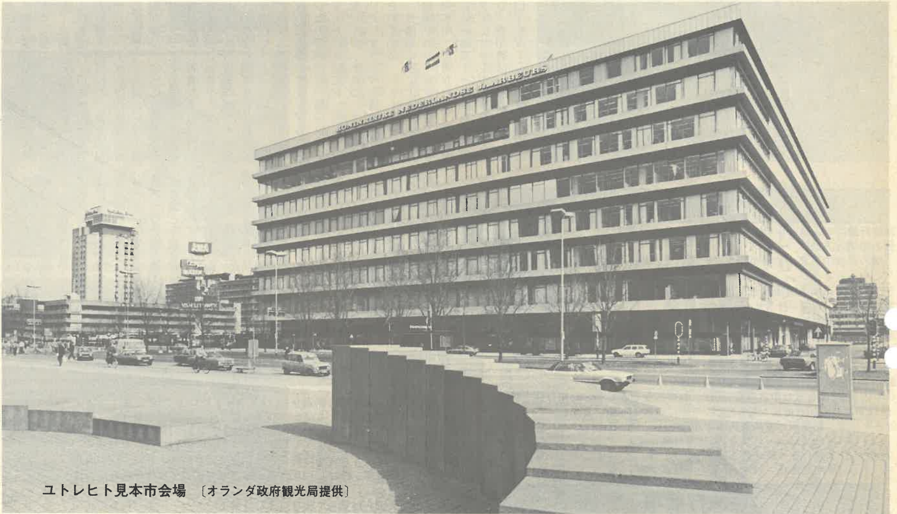
ユトレヒト見本市会場