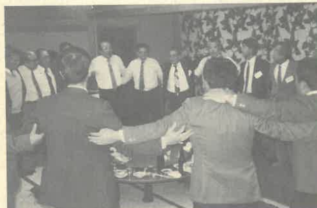
同期の桜、を肩を組みながら輪になってうたい今年も大団円

日本サウナ協会理事会は十一月七日(木)午後二時からニュー・ジャパン観光(株)七階会議室で開催され、そのあと午後五時から割烹日本本店「心木亭」で懇親会が催された。 議題は(1)健康サウナ啓蒙ポスター作製の件、(2)国際サウナ会議参加旅行の件、(3)健康サウナ愛好会実施に関する件、(4)サウナ祭の経過および反省、(5)ヘルストレーナー講習会講師の件、(6)サウナ健康の日に