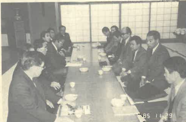
はじめはしんみりと、終わりは次第に盛り上がった関西例会